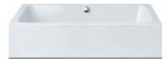
BASSINO mit freistehender Verkleidung.