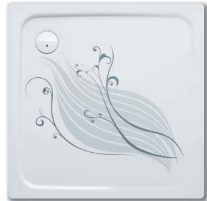
SUPERPLAN mit Antislip Ornament