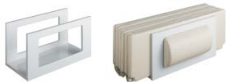
Rack zur Aufbewahrung der Relaxliege und des Kissens.

TOUCH DISPLAY VIVO VARIO PLUS / BELEUCHTETE DÜSEN VIVO TURBO