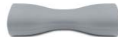
Kissen zum entspannten Floaten. Im Lieferumfang enthalten.