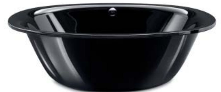
ELLIPSO DUO OVAL mit Verkleidung