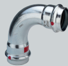
F1 Prestabo (Stahl) Pressverbindungstechnik für unlegierte Stahlrohre