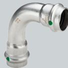
G1 Sanpress Inox (Edelstahl) Pressverbindungstechnik für Edelstahlrohre