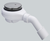
V1 Abläufe für Bade- und Duschwannen