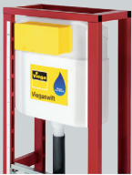
T1 Viegaswift Modulares Vorwand- Installationssystem