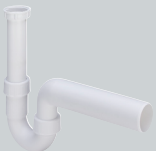
V3 Abläufe für Spülen, Ausgüsse und Geräte