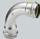
G2 Sanpress Inox G (Edelstahl) Pressverbindungstechnik für die Gasinstallation