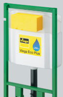
T3 Viega Eco Plus Sanitärelemente für die Vorwand-/Inwandmontage