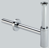
V2 Abläufe für Waschtische und Bidets