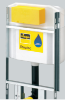
T2 Steptec Vorwand-Baukasten-System